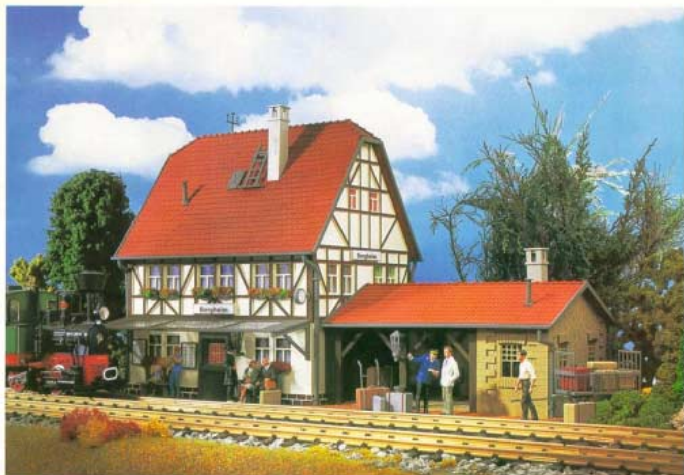
Bahnhof "Bergheim" 680 x 360 x 440 mm Station - Gare - Station 1202 Bausatz - Kit - Boite d'assemblage - Bouwpakket